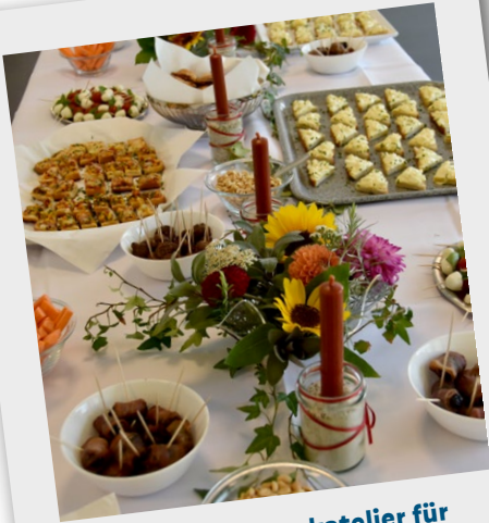
Danke unserem Backatelier für das leckere Apéro