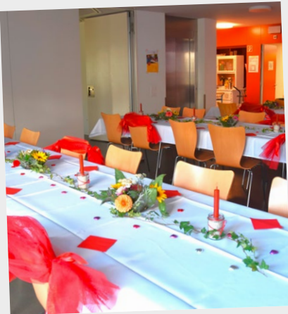
Danke unserem Gartenatelier für die schöne Tischdeko